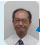
施設長 よい ひとこと